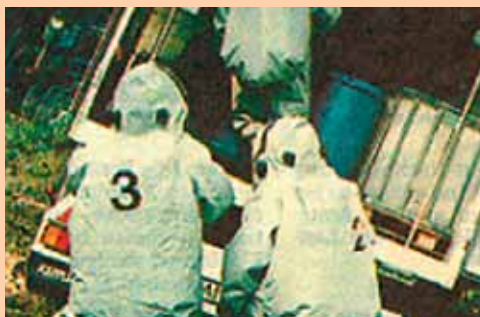
Gefahrgutunfall, B171 Brixlegg Matzenpark, 1994