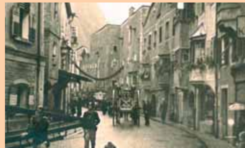
80-jähriges Bestandsjubiläum, 1950