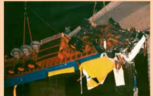
Verkehrsunfall, Autobahnbrücke 1987