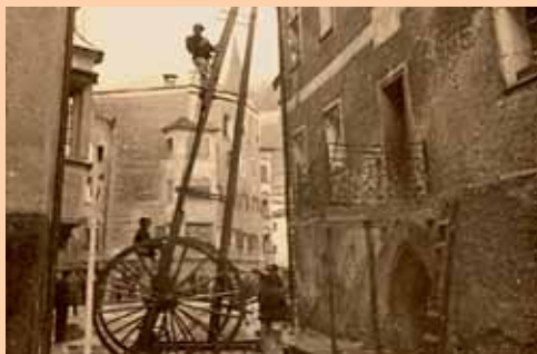
Braunische Balanceleiter, bis 1975