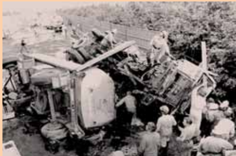
Tankwagenunfall, A12 bei Kramsach 1980