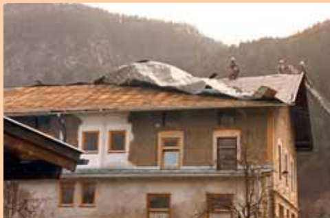
Sturm über Rattenberg, 1987