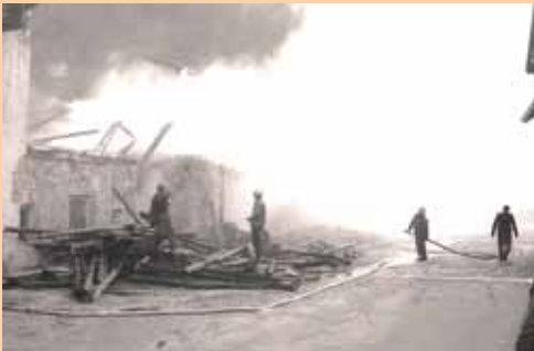
Brand Kremerstadt, Radfeld, 1972