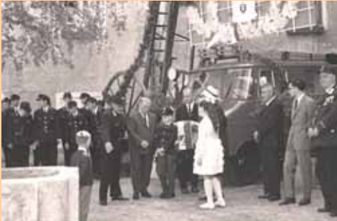
Weihe des »Opel Blitz«, 1962