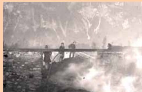
Brand Sägewerk Neukomm Brixlegg, 1930