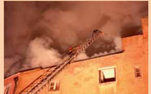
Brand Gasthof Schlosskeller, Rattenberg, 1983