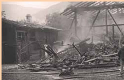
Brand beim »Sixnbauer«, Radfeld, 1952