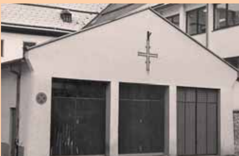
Das alte Gerätehaus, 1906–1992