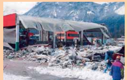
Explosion Tanklager Azwanger, Brixlegg, 1995