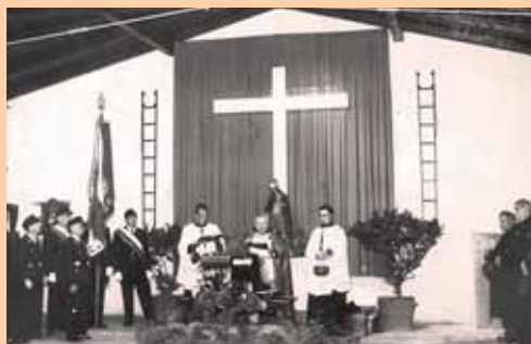
Weihe der Motorspritze »Gugg«, 1957