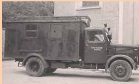
Erstes Feuerwehrfahrzeug in Rattenberg, »Glückner«, 1946–1962