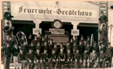
Die Mannschaft der FF Rattenberg, 1950