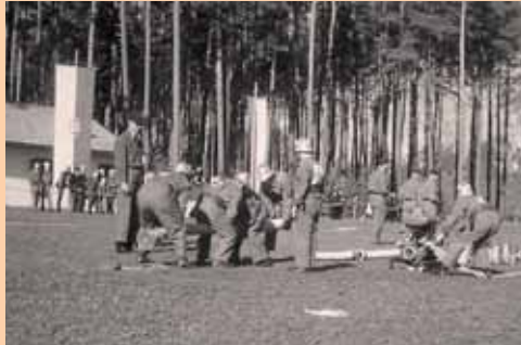
1. Landesfeuerwehrwettbewerb in Silz, 1963