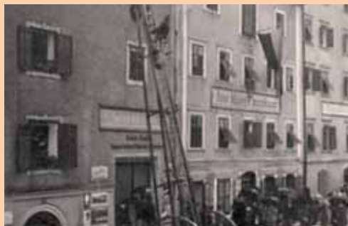
Brand Hinterholzerhaus, Südtiroler Straße 67, Rattenberg, 1904