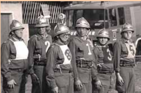
8. Bezirksnassbewerb in Rattenberg, 1984