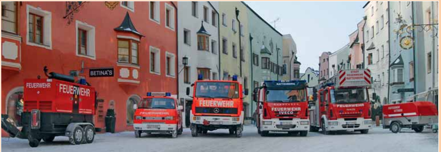
Der Fuhrpark der FF Rattenberg entspricht den derzeitigen Anforderungen.