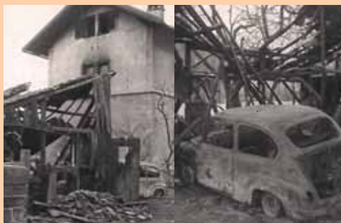
Brand Holzschuppe »Plattner«, Radfeld, 1958